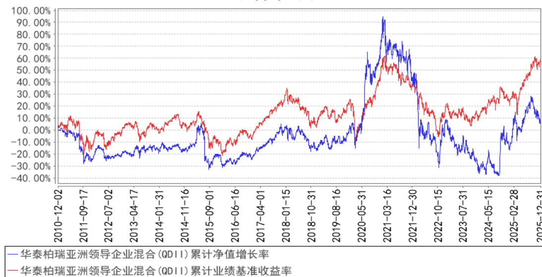
华泰柏瑞亚洲领导企业混合(QDII)累计净值增长率与同期业绩比较基准收益率的历史走势对比图