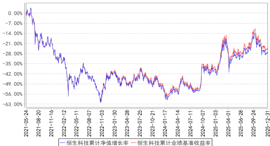
恒生科技累计净值增长率与同期业绩比较基准收益率的历史走势对比图

注：图示日期为 2021 年 5 月 24 日至 2025 年 12 月 31 日。