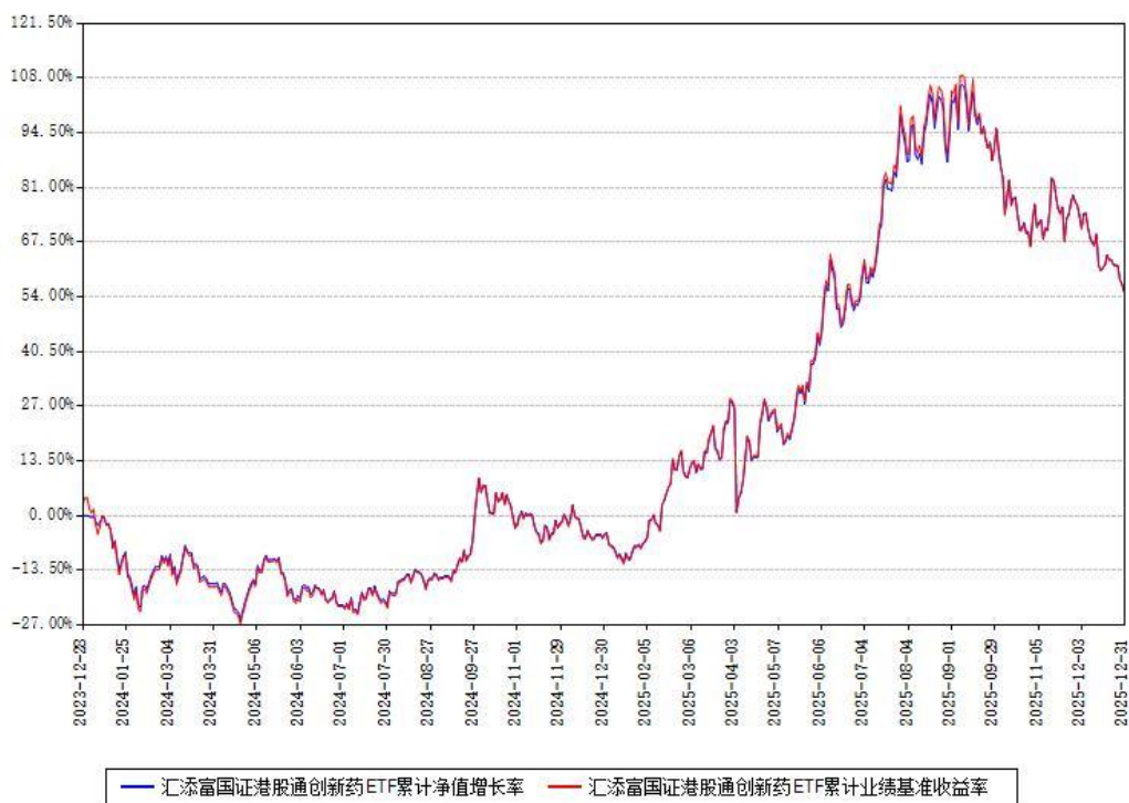
汇添富国证港股通创新药ETF累计净值增长率与同期业绩基准收益率对比图

注：本基金建仓期为本《基金合同》生效之日（2023年12月28日）起6个月，建仓期结束各项资产配置比例符合合同约定。