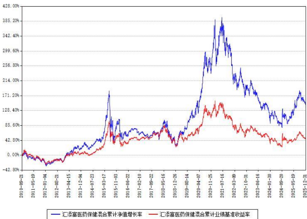
汇添富医药保健混合累计净值增长率与同期业绩基准收益率对比图

注：本基金建仓期为本《基金合同》生效之日（2010年09月21日）起6个月，建仓期结束时各项资产配置比例符合合同约定。