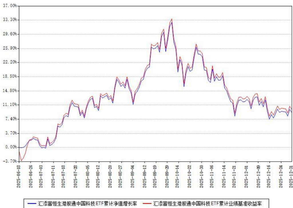
汇添富恒生港股通中国科技ETF累计净值增长率与同期业绩基准收益率对比图

注：本《基金合同》生效之日为 2025 年 06 月 18 日，截至本报告期末，基金成立未满一年。本基金建仓期为本《基金合同》生效之日起 6 个月，截至本报告期末，本基金已完成建仓，建仓期结束时各项资产配置比例符合合同约定。