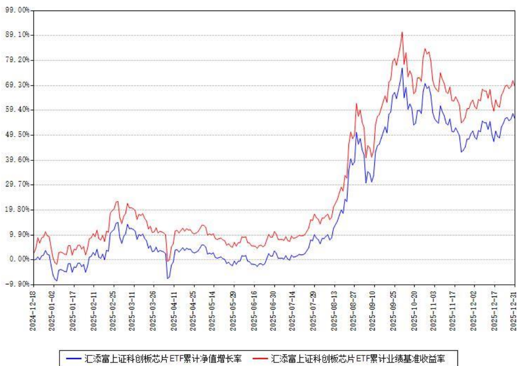
汇添富上证科创板芯片ETF累计净值增长率与同期业绩基准收益率对比图

注：本基金建仓期为本《基金合同》生效之日（2024年12月18日）起6个月，建仓期结束时各项资产配置比例符合合同约定。