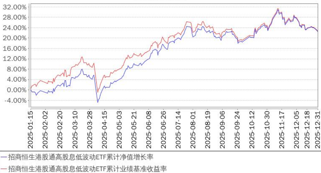
招商恒生港股通高股息低波动ETF累计净值增长率与同期业绩比较基准收益率的历史走势对比图

注：本基金合同于 2025 年 1 月 15 日生效，截至本报告期末基金成立未满一年；自基金成立日起 6 个月内为建仓期，建仓期结束时各项资产配置比例符合合同约定。