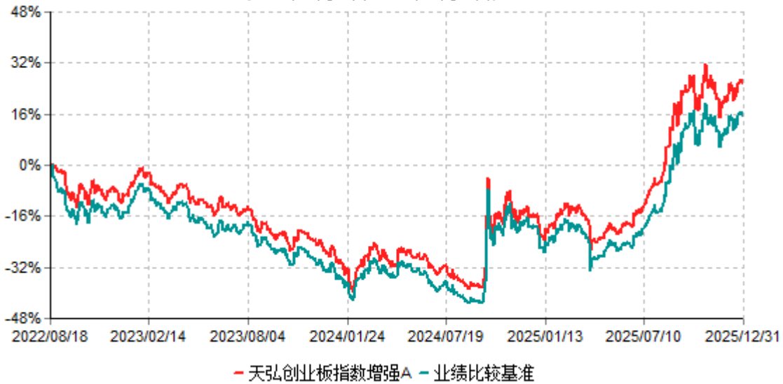
天弘创业板指数增强A累计净值增长率与业绩比较基准收益率历史走势对比图 (2022年08月18日-2025年12月31日)