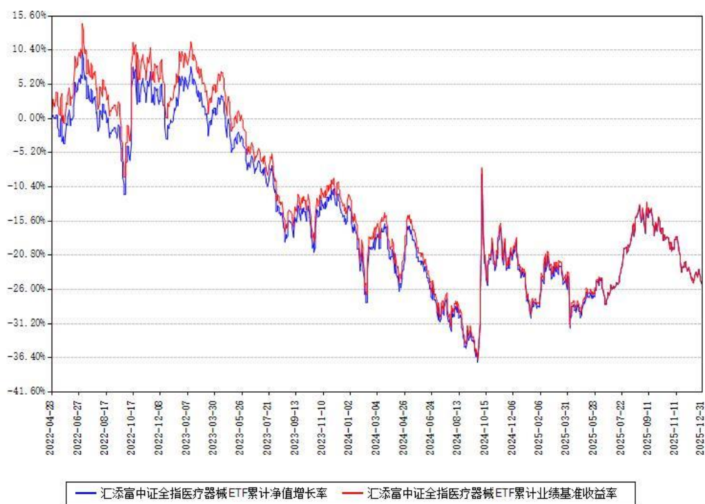
汇添富中证全指医疗器械ETF累计净值增长率与同期业绩比较基准收益率对比图

注：本基金建仓期为本《基金合同》生效之日（2022年04月28日）起6个月，建仓期结束时各项资产配置比例符合合同约定。