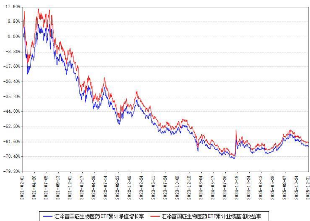
汇添富国证生物医药ETF累计净值增长率与同期业绩比较基准收益率对比图

注：本基金建仓期为本《基金合同》生效之日（2021年02月01日）起6个月，建仓期结束时各项资产配置比例符合合同约定。