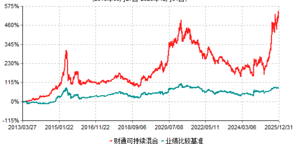
财通可持续混合累计净值增长率与业绩比较基准收益率历史走势对比图 (2013年03月27日-2025年12月31日)