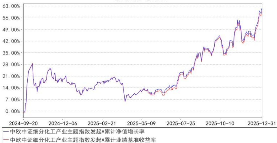
中欧中证细分化工产业主题指数发起A累计净值增长率与同期业绩比较基准收益率的历史走势对比图

注：本基金基金合同生效日期为 2024 年 9 月 20 日，按基金合同的规定，本基金自基金合同生效起六个月为建仓期，建仓期结束时各项资产配置比例已经符合基金合同约定。