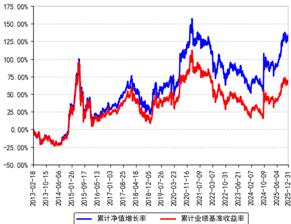
南方沪深300ETF累计净值增长率与同期业绩比较基准收益率的历史走势对比图