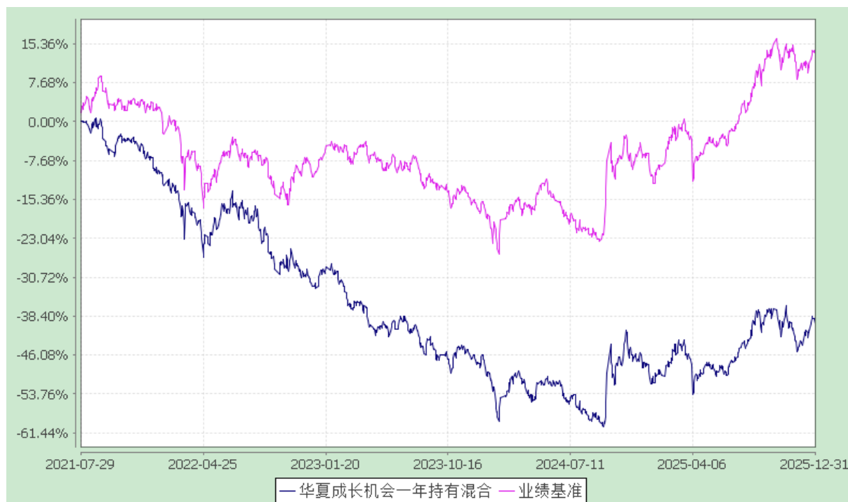
华夏成长机会一年持有期混合型证券投资基金 份额累计净值增长率与业绩比较基准收益率历史走势对比图 (2021年7月29日至2025年12月31日)