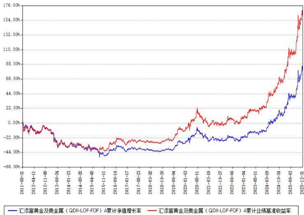
汇添富黄金及贵金属（QDII-LOF-FOF）A累计净值增长率与同期业绩比较基准收益率对比图