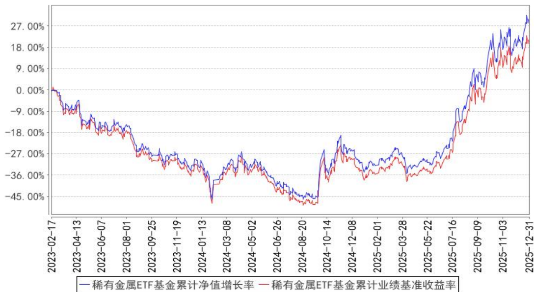
稀有金属ETF基金累计净值增长率与同期业绩比较基准收益率的历史走势对比图