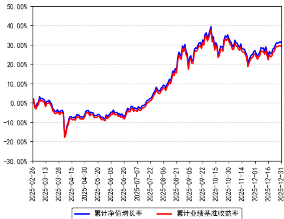
南方上证科创板综合ETF累计净值增长率与同期业绩比较基准收益率的历史走势对比图

注：本基金合同于 2025 年 2 月 26 日生效，截至本报告期末基金成立未满一年；自基金成立日起 6 个月内为建仓期，建仓期结束时各项资产配置比例符合合同约定。