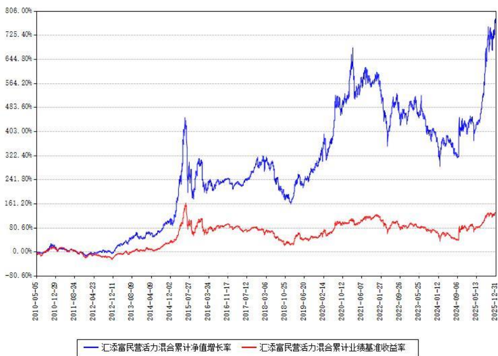
汇添富民营活力混合累计净值增长率与同期业绩比较基准收益率对比图

注：本基金建仓期为本《基金合同》生效之日（2010年05月05日）起6个月，建仓期结束时各项资产配置比例符合合同约定。