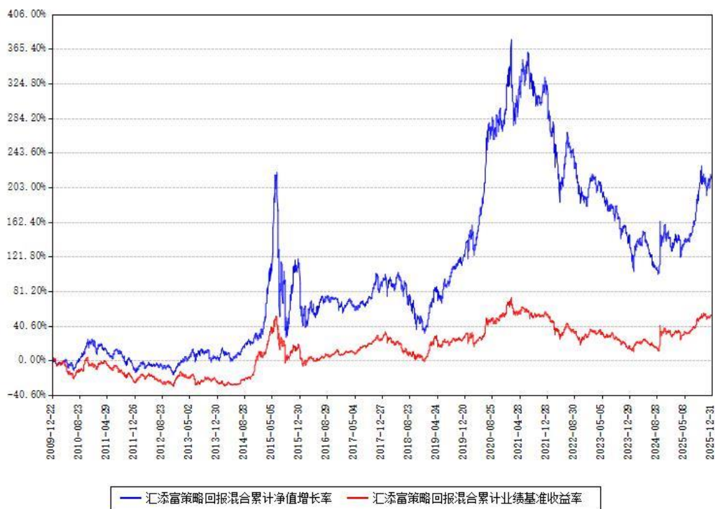
汇添富策略回报混合累计净值增长率与同期业绩基准收益率对比图

注：本基金建仓期为本《基金合同》生效之日（2009年12月22日）起6个月，建仓期结束时各项资产配置比例符合合同约定。