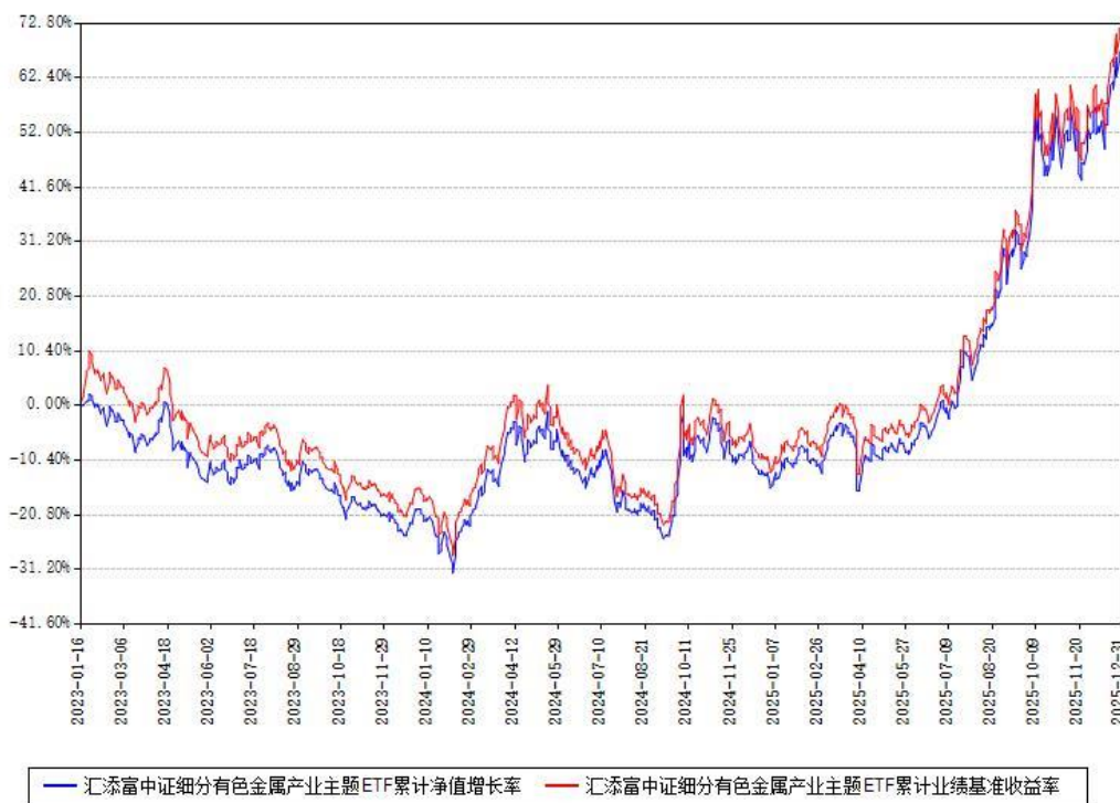
汇添富中证细分有色金属产业主题ETF累计净值增长率与同期业绩比较基准收益率对比图

注：本基金建仓期为本《基金合同》生效之日（2023年01月16日）起6个月，建仓期结束时各项资产配置比例符合合同约定。