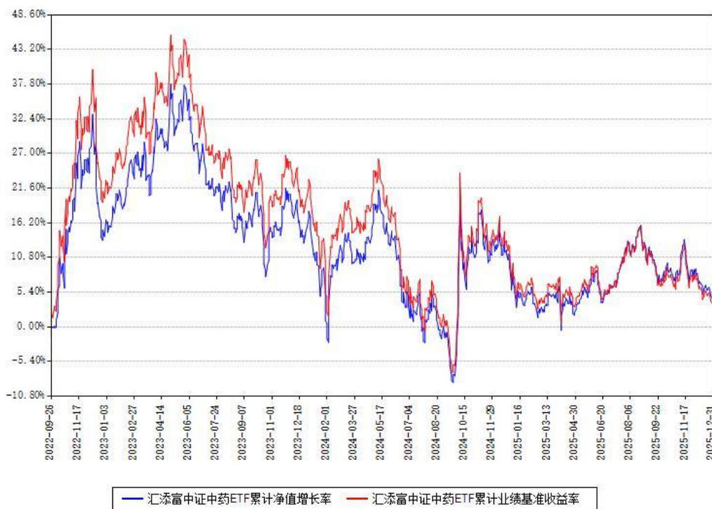
汇添富中证中药ETF累计净值增长率与同期业绩比较基准收益率对比图

注：本基金建仓期为本《基金合同》生效之日（2022年09月26日）起6个月，建仓期结束时各项资产配置比例符合合同约定。