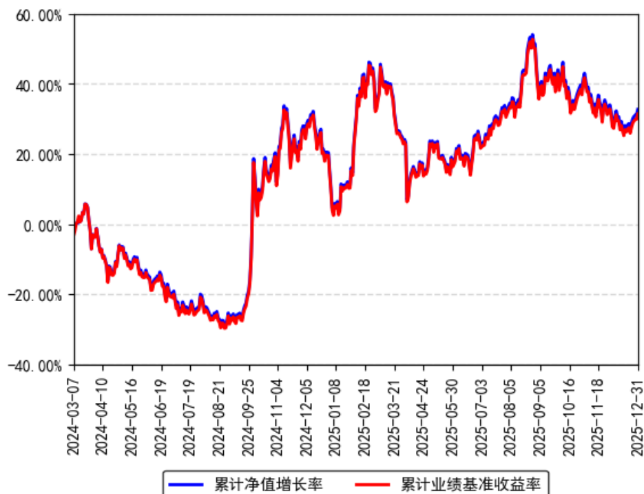
南方中证全指计算机ETF累计净值增长率与同期业绩比较基准收益率的历史走势对比图