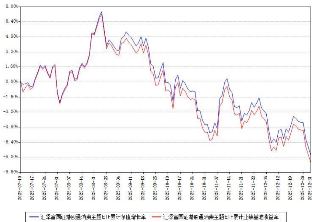
汇添富国证港股通消费主题ETF累计净值增长率与同期业绩基准收益率对比图

注：本《基金合同》生效之日为2025年07月10日，截至本报告期末，基金成立未满一年。本基金建仓期为本《基金合同》生效之日起6个月，截至本报告期末，本基金尚处于建仓期中。