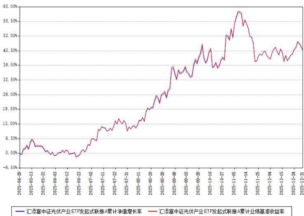
汇添富中证光伏产业ETF发起式联接A累计净值增长率与同期业绩比较基准收益率对比图