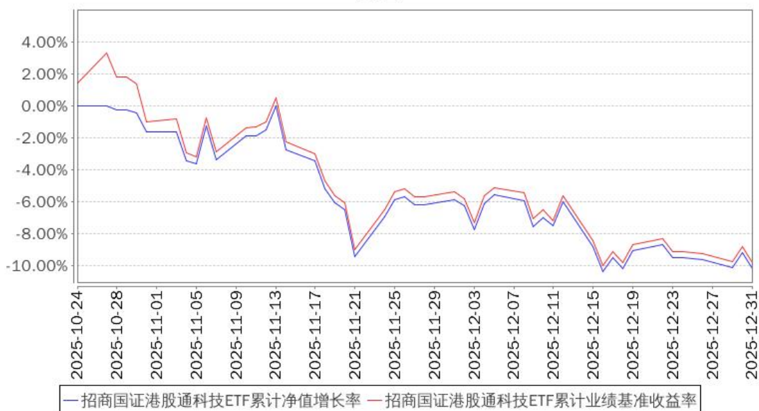
招商国证港股通科技ETF累计净值增长率与同期业绩比较基准收益率的历史走势对比图

注：本基金合同于 2025 年 10 月 24 日生效，截至本报告期末基金成立未满一年；自基金成立之日起 6 个月内为建仓期，截至报告期末基金建仓期尚未结束。