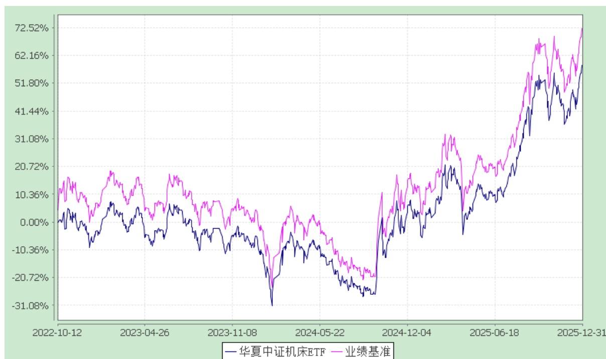
华夏中证机床交易型开放式指数证券投资基金 份额累计净值增长率与业绩比较基准收益率历史走势对比图 (2022 年 10 月 12 日至 2025 年 12 月 31 日)