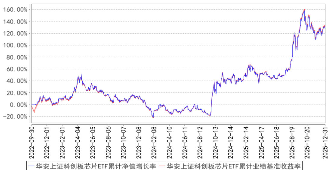
华安上证科创板芯片ETF累计净值增长率与同期业绩比较基准收益率的历史走势对比图