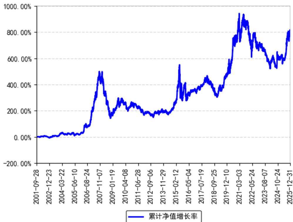
南方稳健成长混合累计净值增长率与同期业绩比较基准收益率的历史走势对比图