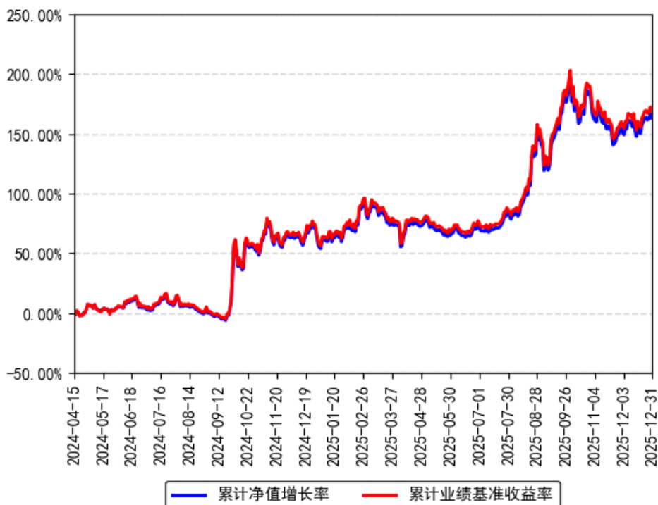
南方上证科创板芯片ETF累计净值增长率与同期业绩比较基准收益率的历史走势对比图