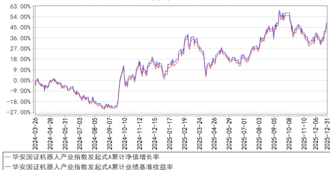
华安国证机器人产业指数发起式A累计净值增长率与同期业绩比较基准收益率的历史走势对比图