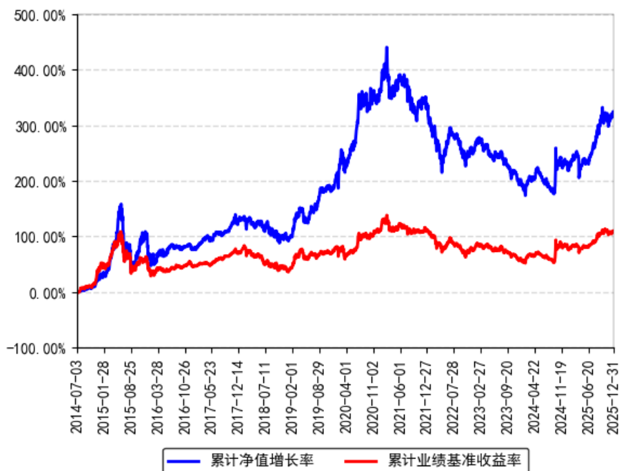
南方天元新产业股票（LOF）累计净值增长率与同期业绩比较基准收益率的历史走势对比图