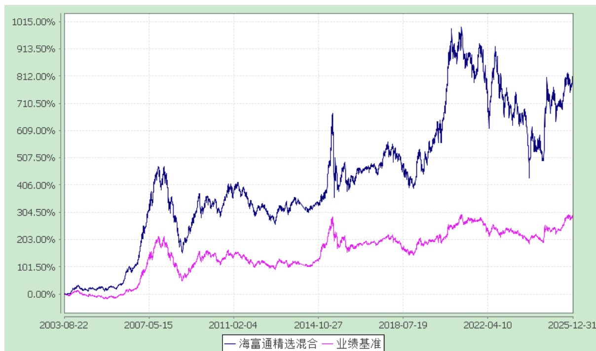
海富通精选证券投资基金 份额累计净值增长率与业绩比较基准收益率的历史走势对比图 (2003 年 8 月 22 日至 2025 年 12 月 31 日)

注：1、按基金合同规定，本基金自基金合同生效起 6 个月内为建仓期。本基金自 2007 年 6 月 28 日至 2007 年 9 月 29 日，为持续营销后建仓期。建仓期满至今，本基金投资组合除个别工作日被动超标外，其余时间均达到本基金合同第十八条（三）、（六）规定的比例限制及本基金投资组合的比例范围。