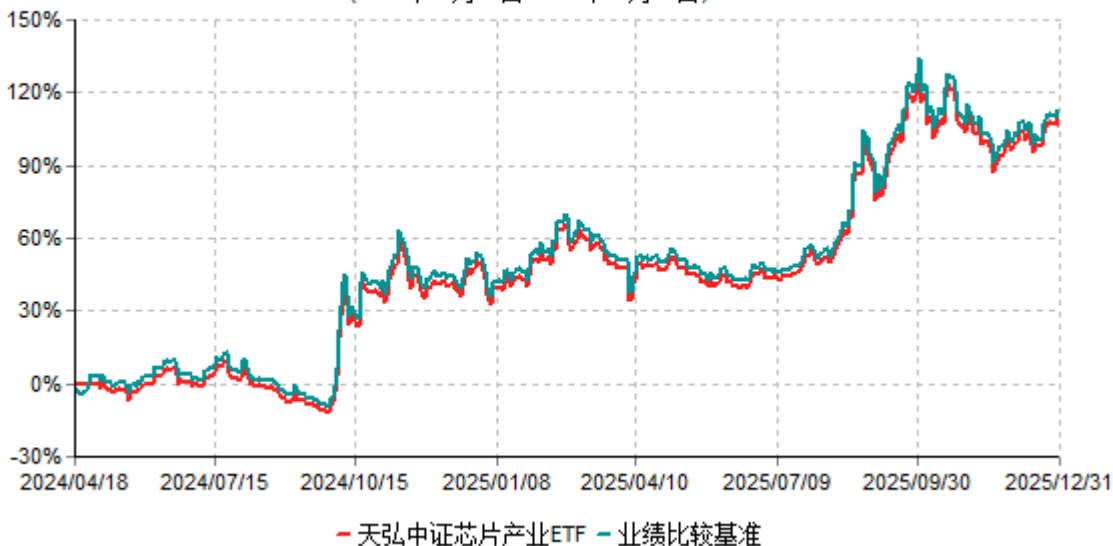
天弘中证芯片产业ETF累计净值增长率与业绩比较基准收益率历史走势对比图 (2024年04月18日-2025年12月31日)

注：1、本基金合同于2024年04月18日生效。 2、本报告期内，本基金的各项投资比例达到基金合同约定的各项比例要求。