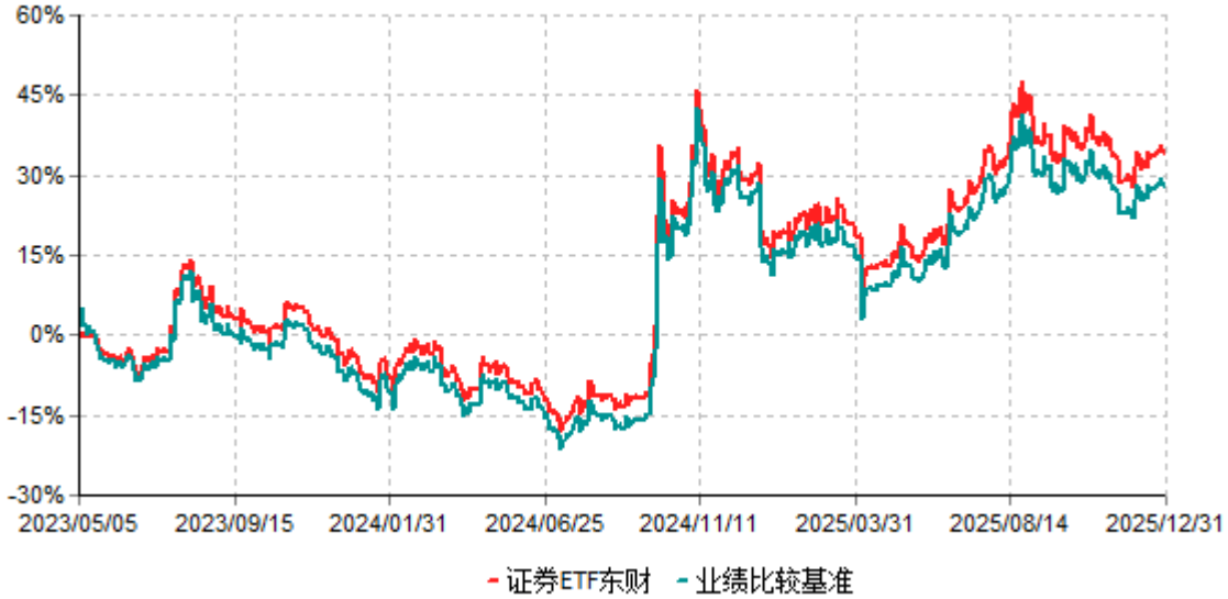
证券ETF东财累计净值增长率与业绩比较基准收益率历史走势对比图 (2023年05月05日-2025年12月31日)