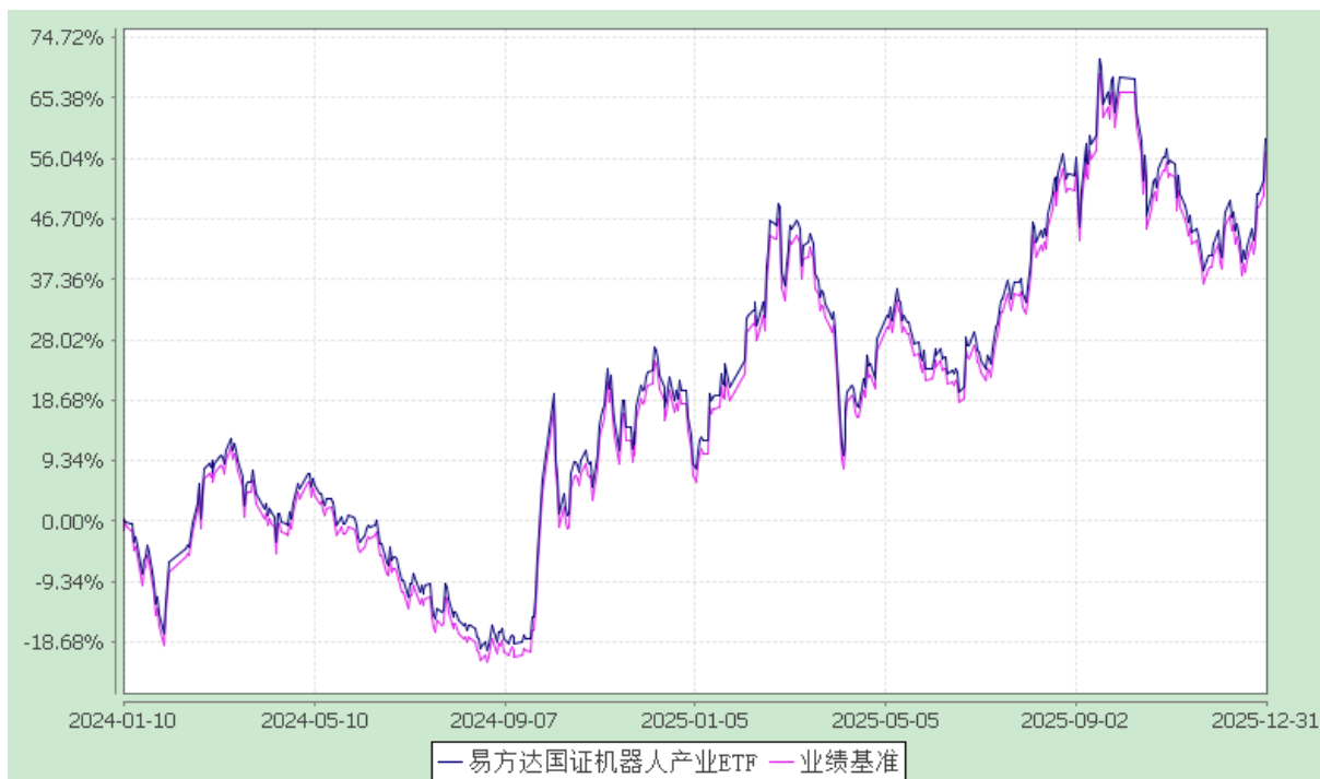
易方达国证机器人产业交易型开放式指数证券投资基金 份额累计净值增长率与业绩比较基准收益率历史走势对比图 (2024 年 1 月 10 日至 2025 年 12 月 31 日)