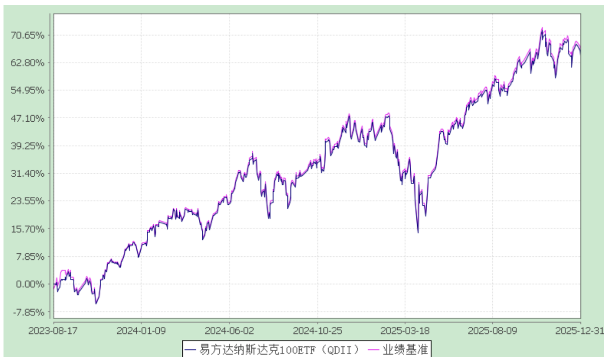
易方达纳斯达克 100 交易型开放式指数证券投资基金 (QDII) 份额累计净值增长率与业绩比较基准收益率历史走势对比图 (2023 年 8 月 17 日至 2025 年 12 月 31 日)