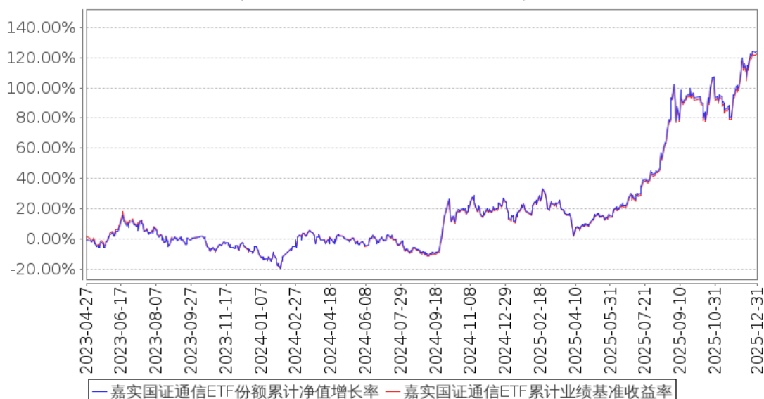
嘉实国证通信ETF份额累计净值增长率与同期业绩比较基准收益率的历史走势对比图 (2023年04月27日至2025年12月31日)

注：按基金合同和招募说明书的约定，本基金自基金合同生效日起 6 个月为建仓期，建仓期结束时本基金的各项资产配置比例符合基金合同约定。