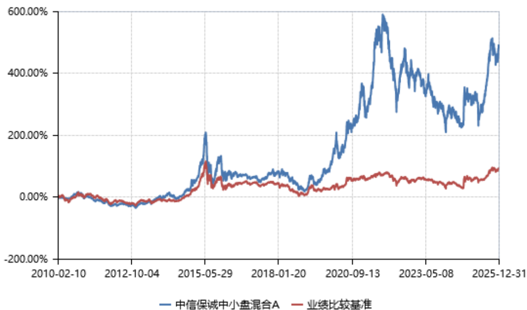
中信保诚中小盘混合 C