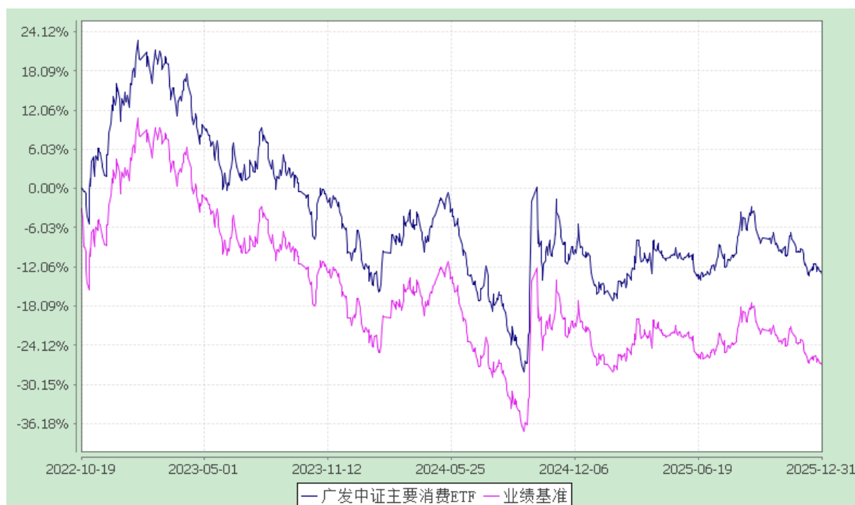
广发中证主要消费交易型开放式指数证券投资基金 份额累计净值增长率与业绩比较基准收益率的历史走势对比图 (2022 年 10 月 19 日至 2025 年 12 月 31 日)