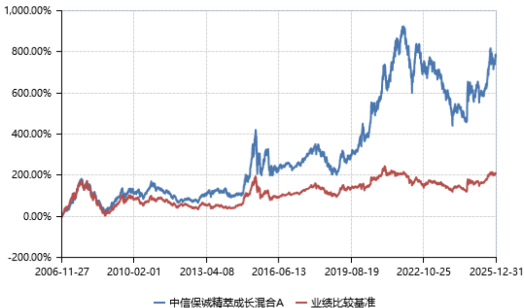
中信保诚精萃成长混合 C