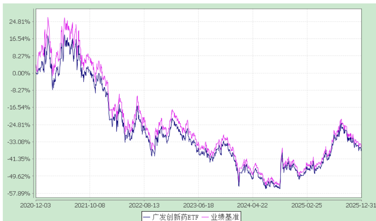
广发中证创新药产业交易型开放式指数证券投资基金 份额累计净值增长率与业绩比较基准收益率的历史走势对比图 (2020年12月3日至2025年12月31日)