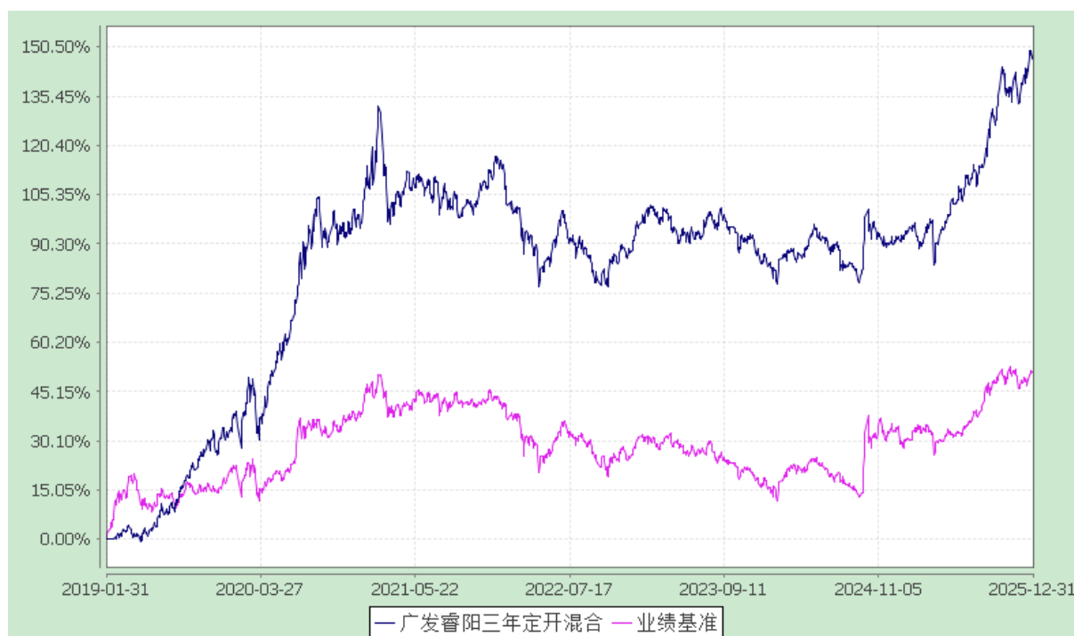
广发睿阳三年定期开放混合型证券投资基金 份额累计净值增长率与业绩比较基准收益率的历史走势对比图 (2019年1月31日至2025年12月31日)