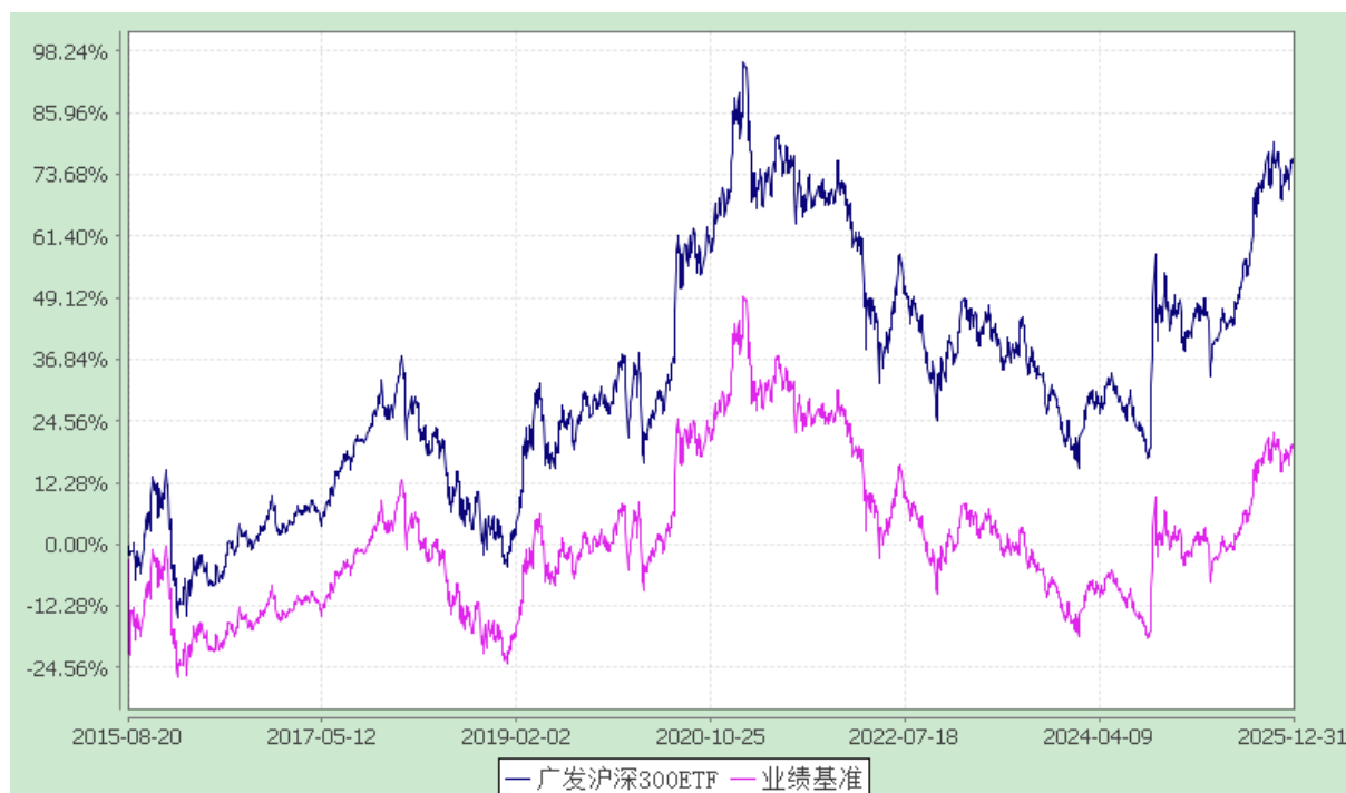
广发沪深 300 交易型开放式指数证券投资基金 份额累计净值增长率与业绩比较基准收益率的历史走势对比图 (2015 年 8 月 20 日至 2025 年 12 月 31 日)