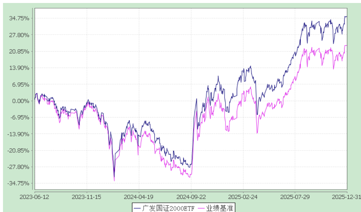
广发国证 2000 交易型开放式指数证券投资基金 份额累计净值增长率与业绩比较基准收益率的历史走势对比图 (2023 年 6 月 12 日至 2025 年 12 月 31 日)

注: 本基金于 2023 年 6 月 12 日正式转型为广发国证 2000 交易型开放式指数证券投资基金。