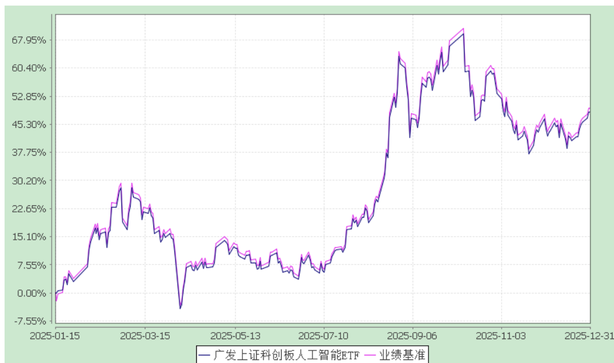
广发上证科创板人工智能交易型开放式指数证券投资基金 份额累计净值增长率与业绩比较基准收益率的历史走势对比图 (2025 年 1 月 15 日至 2025 年 12 月 31 日)

注：（1）本基金合同生效日期为 2025 年 1 月 15 日，至披露时点未满一年。