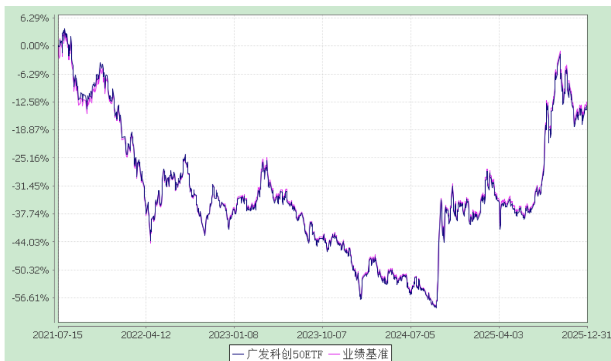
广发上证科创板 50 成份交易型开放式指数证券投资基金 份额累计净值增长率与业绩比较基准收益率的历史走势对比图 (2021 年 7 月 15 日至 2025 年 12 月 31 日)