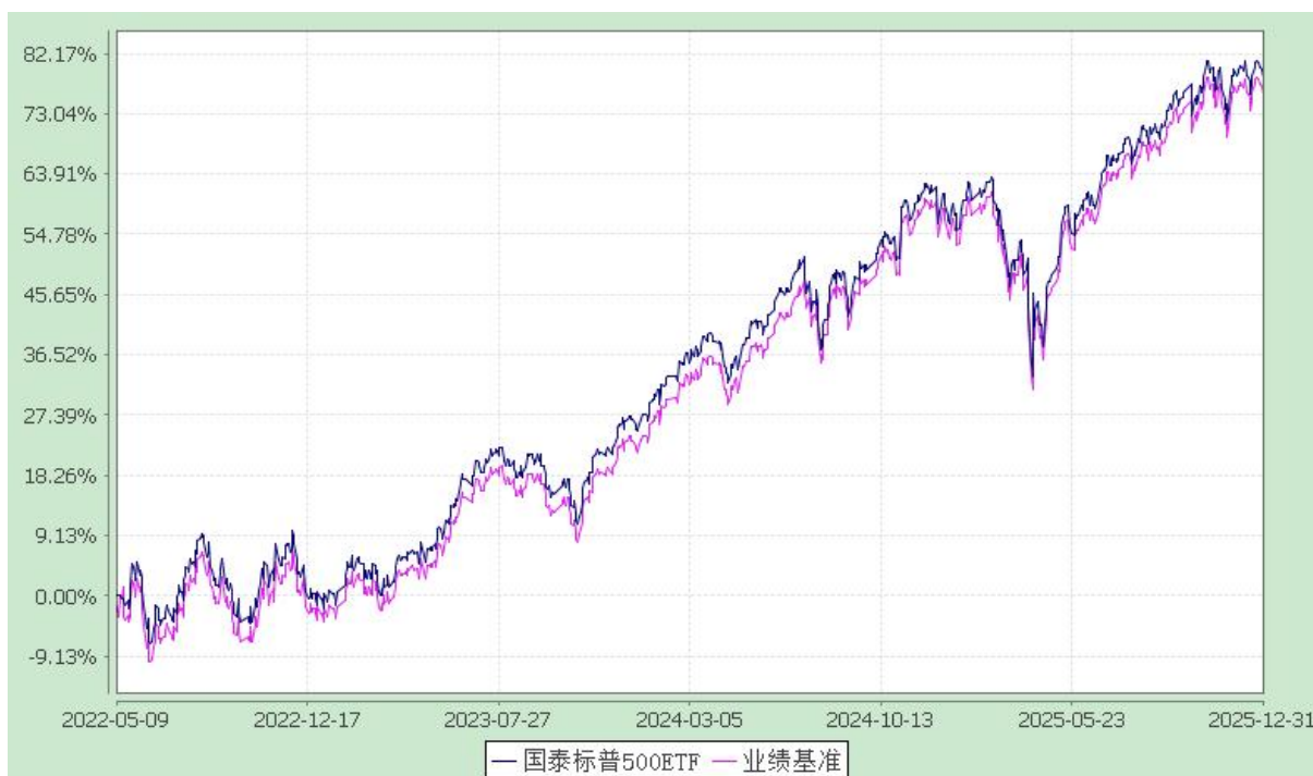
国泰标普 500 交易型开放式指数证券投资基金 (QDII) 份额累计净值增长率与业绩比较基准收益率历史走势对比图 (2022 年 5 月 9 日至 2025 年 12 月 31 日)

注：（1）本基金的合同生效日为 2022 年 5 月 9 日，在 6 个月建仓期结束时，各项资产配置比例符合合同约定。