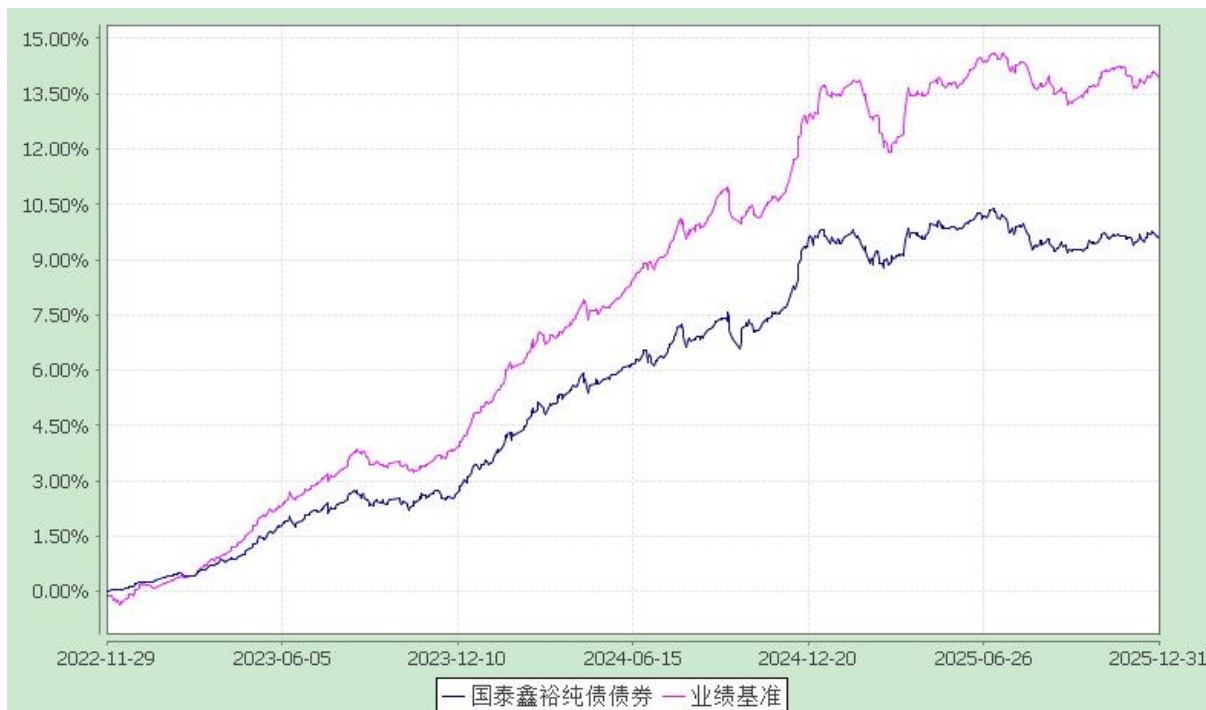
自基金合同生效以来份额累计净值增长率与业绩比较基准收益率的历史走势对比图 (2022 年 11 月 29 日至 2025 年 12 月 31 日)

注：本基金合同生效日为 2022 年 11 月 29 日。本基金在六个月建仓期结束时，各项资产配置比例符合合同约定。