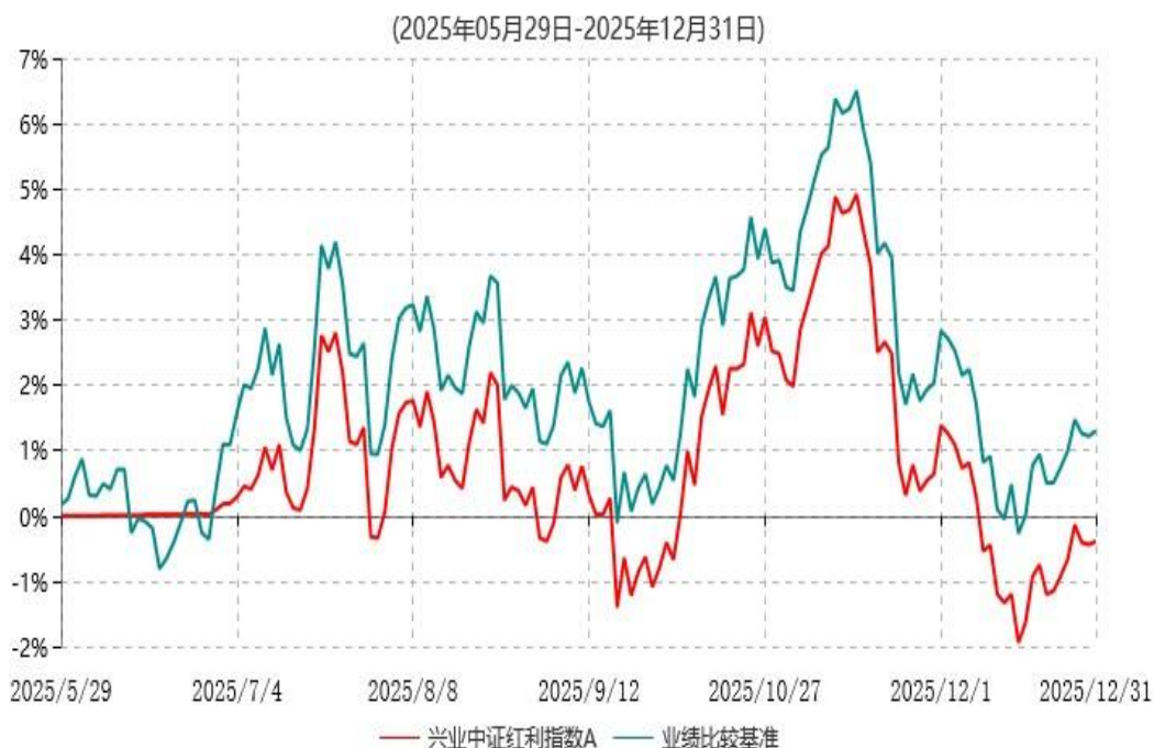
兴业中证红利指数A累计净值增长率与业绩比较基准收益率历史走势对比图