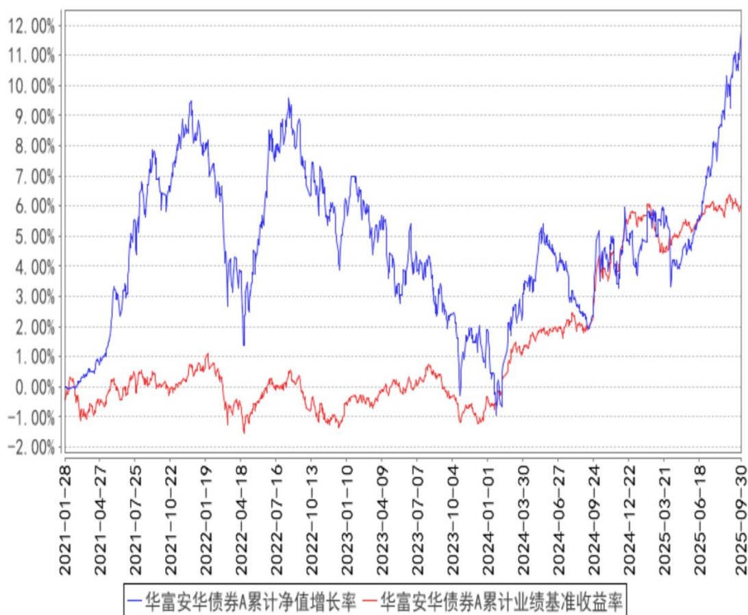
华富安华债券A累计净值增长率与同期业绩比较基准收益率的历史走势对比图

(二) 自基金合同生效以来基金份额累计净值增长率变动及其与同期业绩比较基准收益率变动的比较